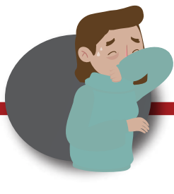
Cubre boca y nariz al toser o estornudar usando la parte interior del codo o con un pañuelo desechable