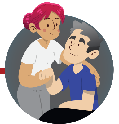
Cuando cuides enfermos