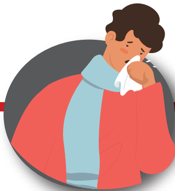
Después de toser o estornudar