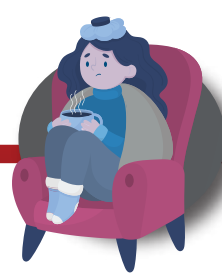
Quédate en casa cuando estés enfermo