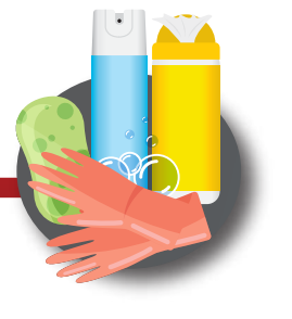
Limpia y desinfecta los objetos y superficies

Si presentas fiebre, malestar general, tos seca y/o dificultad para respirar, acude a la unidad de atención médica y